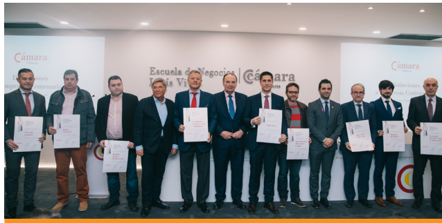
Entrega diplomas empresas centenarias

En el Pleno del 25 de noviembre, se reconoció los más de 100 años de trayectoria de una decena de empresas valencianas, con la entrega de un diploma a cada una de ellas: Vicente Gandía, Extintores Carreras S.L. "Minimax", Levante El Mercantil Valenciano, Joyería Falomir, Forn de Litri, Aguas de Valencia, Safta, S.A., Bernia Forn i Pastisseria, José Martínez Medina, Instrumentos Musicales Gaspar.