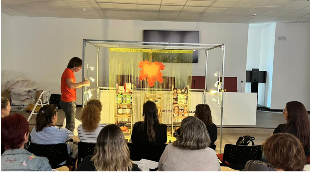
Sesión sobre capacitación especializada en escaparatismo